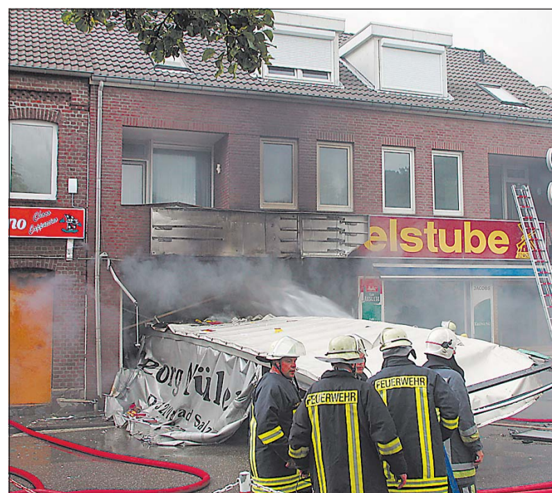
Der Lkw raste in diesen Supermarkt. Der 41 Jahre alte Fahrer sowie ein 34-jähriger Mann und eine 55-jährige Frau starben bei dem Unfall.

Bad Salzuflen (WB). Vier Jahre nach dem Lastwagen-Unfall im niederländischen Kerkrade mit drei Toten ist das Strafverfahren gegen den Werkstattleiter einer Spedition aus Bad Salzuflen (Kreis Lippe) endgültig eingestellt worden.