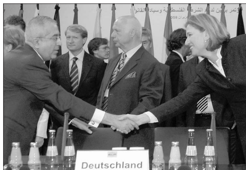
Der palästinensische Premierminister Slam Fayyad (links) begrüßt in Berlin die israelische Außenministerin Zivi Livni.